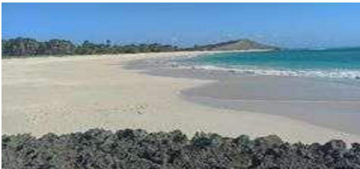
Gambar 2. Pantai Liman

Pantai Liman berada di Barat Daya Pulau Semaui. Masuk wilayah administrasi Desa Utiuh Tuan, Kecamatan Semaui Selatan, Kabupaten Kupang, NTT. Berjarak sekitar 30 kilometer dari Pelabuhan Ferry Hansisi dan 9 kilometer setelah Pantai Uinian. Untuk menuju Pantai Liman ini membutuhkan extra waktu dan tenaga sebab lumayan jauh dari pusat kota Kupang. Pelabuhan penyebrangannya ada 2 yakni melalui kapal Ferry di Bolok Kupang atau pelabuhan Rakyat Di Tenanu Kupang. Salah satu daya tarik utama Pantai Liman adalah hamparan pasirnya yang berwarna putih sepanjang sekitar 1000 meter. Garis Pantai Liman membentang sekitar 1 kilometer dari utara ke selatan. Bentangan pasirnya luas. Pantai ini disebut sebagai Pantai Liman karena terdapat bukit yang terletak tepat dibagian bibir pantai yang bernama Bukit Liman sehingga masyarakat setempat memberi nama Pantai Liman. Pantai ini memiliki keindahan alam berupa pasir putih yang panjang, bersih, yang terletak diantara bukit Liman yang terdapat di ujung pantai dan pulau Tabui yang terdapat di seberang pantai. Berikut foto dari keindahannya Pantai Liman.