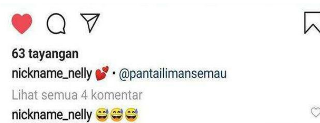
Gambar 11. Fitur Mentions

Fitur mentions adalah pemanggil bagi pengguna Instagram untuk dapat melihat suatu unggahan dari pengguna lain. Pengguna memanggil akun Instagram lain dengan menggunakan tanda arroba (@) dan nama akun yang dituju. Berikut adalah contoh penggunaan mentions dari seorang wisatawan yang berkunjung ke Pantai Liman dengan menyertakan tanda arroba (@) pada kolom caption pada video yang diupload dengan menggunakan mentions @pantailimansemau.