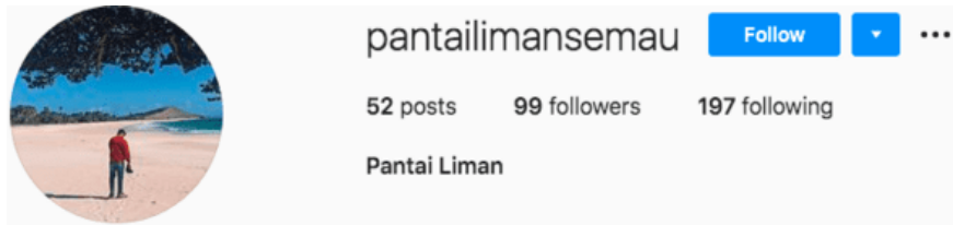
Gambar 4. Akun Instagram Pantai Liman

Bentuk pemanfaatan Instagram dalam mempromosikan akan dijelaskan berdasarkan fitur-fitur yang dimiliki media sosial Instagram . Sehingga, penggunaan fitur tersebut dapat mempermudah pengguna dalam melakukan promosi pariwisata di Pantai Liman. Penggunaan fitur selanjutnya bermanfaat untuk menarik pengunjung agar mengetahui dan berkunjung ke wisata Pantai Liman. Berikut adalah fitur-fitur yang digunakan dalam memanfaatkan instagram @pantailimansemau sebagai upaya promosi Pantai Liman: