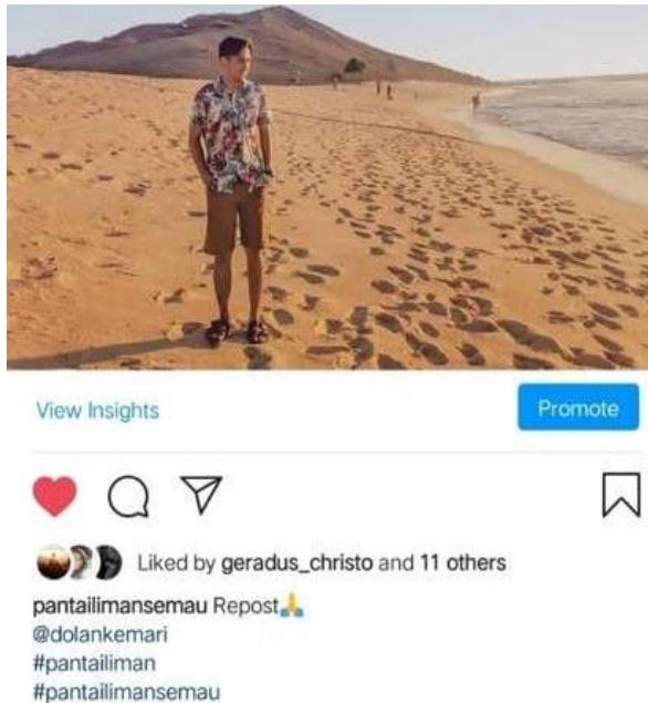
Gambar 5. Penggunaan Hashtag #pantailiman

Berdasarkan pengamatan penelitian, hashtag #pantailiman di Instagram sudah berjumlah lebih dari 1000 unggahan. Artinya sudah lebih dari 1000 foto yang diunggah untuk mempromosikan daya tarik wisata Pantai Liman di Semau. Dengan adanya hashtag #pantailiman maka semakin banyak calon pengunjung yang mengetahui daya tarik wisata Pantai Liman dengan mudah baik pengunjung yang berasal dari NTT maupun dari luar pulau bahkan lintas provinsi. Penggunaan fitur hashtag ini dapat memudahkan pengguna untuk menemukan daya tarik wisata tertentu. Cukup dengan menulis di penelusuran Instagram dengan #pantailiman maka akan menampilkan berbagai gambar-gambar atau foto-foto dari pengunjung yang sudah pernah mengunggah foto mengenai Pantai Liman sebagai sarana promosi bagi wisatawan yang belum pernah ke Pantai Liman agar tertarik berkunjung ke Pantai Liman Semau. Berikut fitur hashtag #pantailiman melalui penelusuran di Instagram :