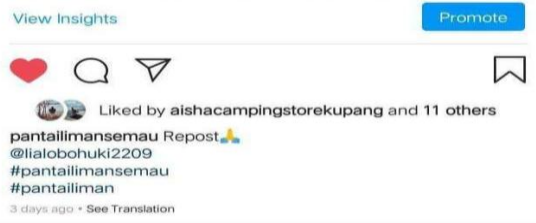
Gambar 9. Fitur Repost

Repost foto dimanfaatkan agar calon pengunjung semakin berniat berwisata ke Pantai Liman. Pengguna Instagram yang ingin melakukan repost foto terbiasa untuk melakukan seleksi unggahan terlebih dahulu sebelum melakukan repost foto. Hal ini bertujuan untuk memaksimalkan manfaat repost dengan menambah referensi potensi wisata yang belum dikunjungi oleh wisatawan lain yang menggunakan Instagram .