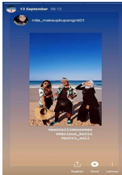
Gambar 7. Fitur Instagram Stories

@pantailimansemau. Adapun fitur ini dapat dinikmati oleh berbagai pengguna Instagram terutama bagi pengguna yang sudah saling berteman. Fitur ini lebih fleksibel karena cenderung diunggah pada waktu kejadian terjadi. Pengguna terbiasa langsung mengunggah posting-an Instagram story untuk melakukan update situasi yang sedang dilakukan termasuk melakukan wisata. Berikut adalah contoh pemanfaatan tampilan Instagram story untuk kepentingan promosi Pantai Liman Semau.