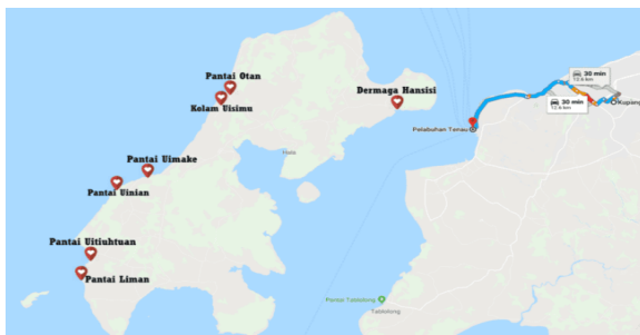
Gambar 1. Peta Pantai Liman

Pulau Semau merupakan sebuah pulau kecil di sebelah barat Pulau Timor di Provinsi Nusa Tenggara Timur. Pulau ini bertetangga dengan Pulau Rote dan juga Pulau Timor. Letak Pulau Semau adalah di bagian barat Kota Kupang. Pulau ini memiliki penduduk sekitar 8.000 jiwa dan mayoritas diisi oleh penduduk Helong, salah satu suku di wilayah Nusa Tenggara Timur. Pulau Semau memiliki banyak sekali potensi wisata yang sebenarnya belum dapat diperhatikan oleh pemerintah setempat walaupun demikian kalau diperhatikan secara dekat maka potensi yang dimilikinya adalah merupakan kekayaan budaya karena terdiri atas beragam suku. Selain itu terdapat juga potensi lain yaitu pertanian, peternakan, kelautan dan juga potensi pariwisata yang saat ini menjadi perhatian wisatawan yaitu potensi wisata Pantai Liman.