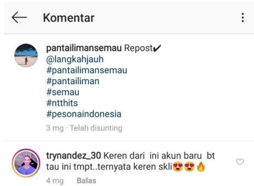
Gambar 10. Fitur Comment

Berdasarkan komentar salah satu pengguna media sosial Instagram , disebutkan bahwa pengguna merasa terbantu dengan adanya platform media sosial yang memberikan informasi mengenai daya tarik wisata Pantai Liman dan memberikan komentar positif kepada foto Pantai Liman.