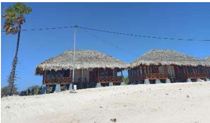
Gambar 3. Fasilitas Homestay Pantai Liman

Masih ada beberapa ruas jalan yang belum diaspal sehingga membuat wisatawan tidak nyaman saat menuju lokasi wisata Pantai Liman. Dalam memenuhi kebutuhan pengunjung dibutuhkan fasilitas yang memadai disekitar destinasi wisata. Fasilitas yang sudah ada di Pantai Liman berupa lopo, homestay dan toilet yang sudah memadai namun lapak jualan yang terdapat disekitar Pantai Liman belum memadai karena hanya menjual makanan lokal seperti kelapa muda dan belum tersedia makanan lokal lainnya yang dijual di lapak sehingga belum dapat memenuhi kebutuhan wisatawan yang datang berkunjung. Pantai Liman saat ini sudah dilengkapi dengan fasilitas berupa 16 kamar homestay (rumah inap) yang disediakan untuk pengunjung, selain homestay di Pantai Liman juga sudah disediakan cottage dan rumah makan yang dibangun dalam rangka pembenahan aspek akomodasi pada destinasi wisata unggulan baru. Berikut adalah gambar fasilitas homestay yang ada di Pantai Liman.