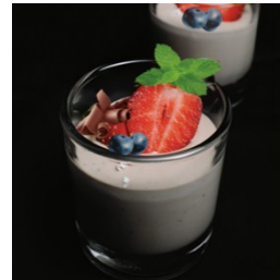
Gambar.9 Kecombrang C. Mousse

Mousse dalam bahasa perancis yaitu foam atau busa. Memiliki tekstur yang ringan, dan cara pembuatannya yang membutuhkan gelembung udara untuk menciptakan tekstur cerah dan berlubang. Modifikasi yang dilakukan yaitu memberi campuran dari chocolate dan infused dari bunga kecombrang. Untuk aroma terdapat perpaduan cokelat dengan harumnya bunga kecombrang.