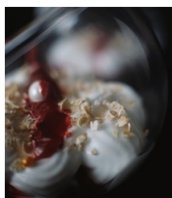
Gambar.4 Kecombrang Cranachan

Cranachan adalah hidangan penutup khas Skotlandia yang awalnya digunakan saat perayaan panen buah raspberi saat musim panas. Isianya terdiri dari whipped cream , whisky , madu dan oat. Modifikasi yang dilakukan yaitu pada layer cranachan diberi campuran selai kecombrang dengan buah raspberi, serta terdapat potongan bunga kecombrang di setiap layer tersebut.