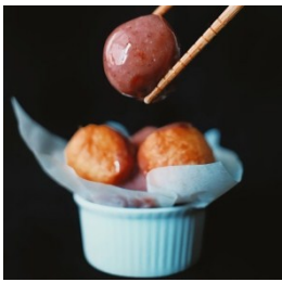
Gambar.6 Kecombrang Loukoumades

dengan menambahkan campuran compote bunga kecombrang dengan white chocolate .