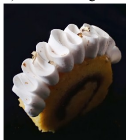
Gambar.3 Kecombrang Roll Cake Sumber : Dokumentasi, 2022

Roll Cake atau bolu gulung adalah variasi olahan kue sponge yang telah ada sejak abad ke-19 yang berasal dari Austria. Untuk isianya bervariasi, dan setiap negara berbeda-beda. Modifikasi yang dilakukan yaitu pada isian roll cake diberi dengan selai bunga kecombrang yang terbuat dari buah raspberry dan bunga kecombrang.