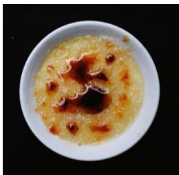
Gambar.7 Kecombrang Crema

Lalu diberi lapisan gula di atasnya. Modifikasi yang dilakukan yaitu terdapat dua layer, layer pertama sebagai layer original, layer kedua yaitu terdapat campuran dari compote bunga kecombrang dengan adonan crema catalana . Sehingga terciptanya dua warna yang berbeda.