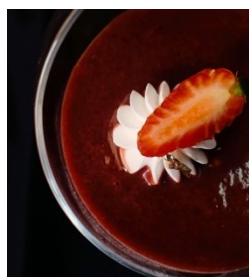
Gambar.5 Kecombrang Panna Cotta

Panna cotta adalah hidangan penutup khas Italia yang merupakan pudding berbahan dasar cream yang dimasak dengan gelatin dan diberi berbagai macam rasa. Modifikasi yang dilakukan yaitu penambahan pada topping panna cotta dengan penambahan compote bunga kecombrang dengan buah raspberi.