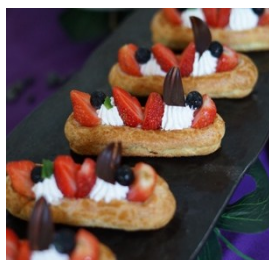
Gambar.1 Kecombrang Éclair

Éclair adalah salah satu varian choux pastry yang dibentuk memanjang serta isian aneka vla dan dicelup kedalam topping yang berisi cokelat. Modifikasi yang dilakukan yaitu pada isian éclair serta toppingnya. Isian éclair terbuat dari diplomat cream dengan campuran bunga kecombrang yang telah dijadikan compote terlebih dahulu. Untuk topping, terbuat dari white chocolate yang dilelehkan lalu dicampur dengan compote bunga kecombrang.